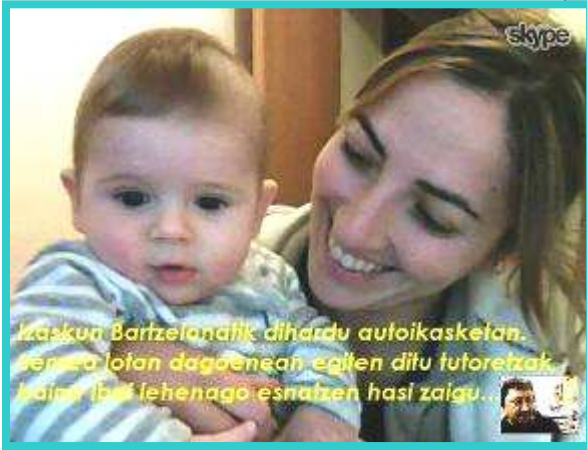
Kaskun Bartzelonatik dihardu autoikasketan. Keskua lotan dagoenean egiten ditu tutoretzak. Baina ibai lehenago esnatzen hasi zaigu...

■ Hemos estrenado nuevo curso, y como ya es costumbre, estas dos páginas de euskarak lagun las dedicamos a una serie de instantáneas de nuestros/as alumnos/as. Aquí tenéis a algunas imágenes.