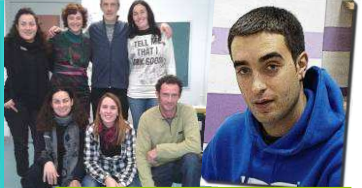
Bastidan EGA bila