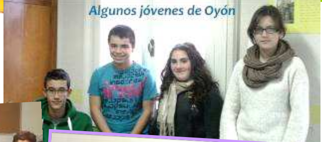
Algunos jóvenes de Oyón