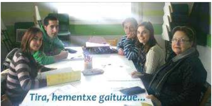
Tira, hemenxe gaituzue...