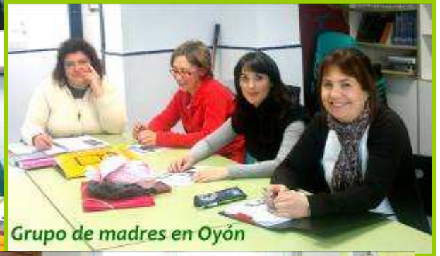
Grupo de madres en Oyón