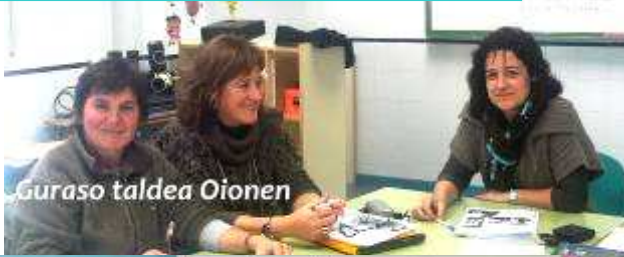
Guraso taldea Oionen