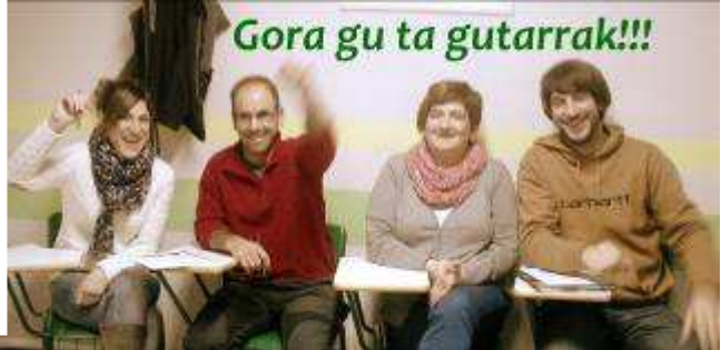
Gora gu ta gutarrak!!!